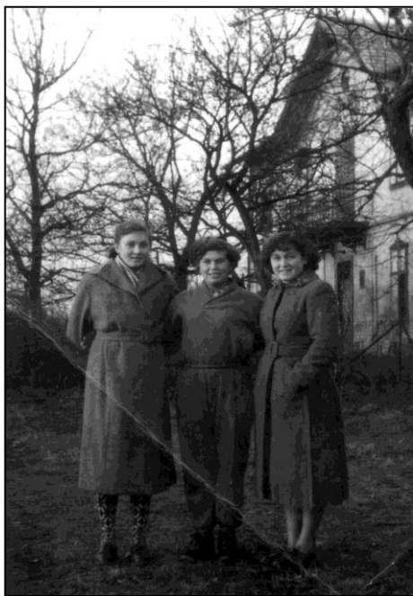
Učnice v bývalom kláštore spasieliek

Po roku 1953 kláštorné priestory využívala Družstevná učňovská škola pre Jednotu – dedinské spotrebné a výrobné družstvo pre vyučenie kuchárov, predavačiek a aranžérkok.